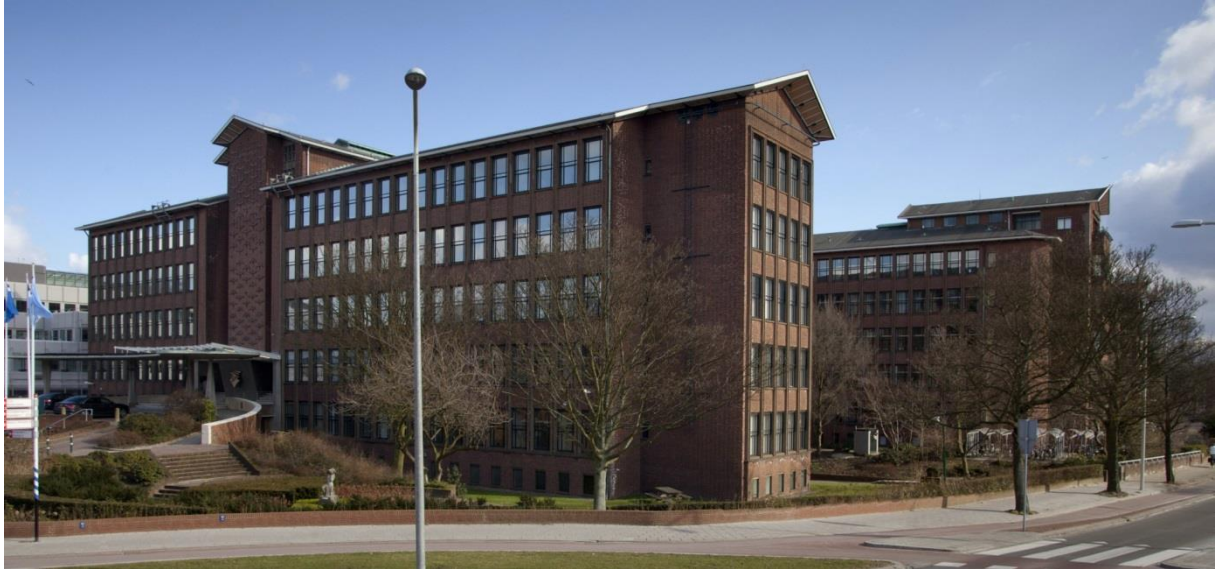
Figuur 2. Monumentale gebouw Plesmanweg 1-6