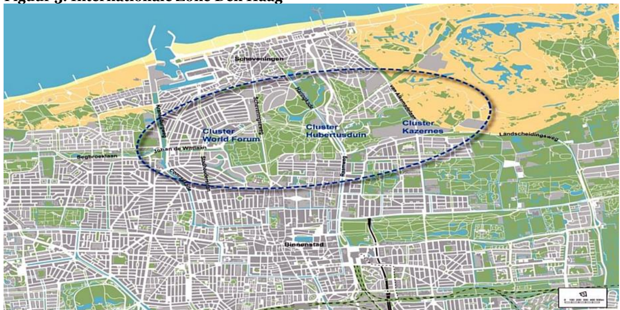
Figuur 3. Internationale Zone Den Haag

De locatie van het kantoorgebouw Plesmanweg is gelegen binnen de Internationale Zone. Dit is hét gebied waar de stad Den Haag haar ambities voor stad van Vrede & Recht gestalte geeft. Deze ambities zijn vertaald in de Gebiedsvisie Internationale Zone, waarin drie clusters worden benoemd waar internationale instellingen geconcentreerd kunnen worden. Eén daarvan is het cluster Hubertusduin waarbinnen de locatie Plesmanweg gelegen is.