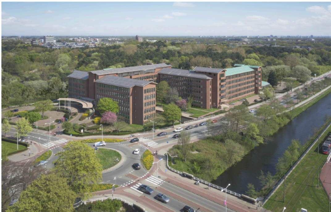
BRUTO VLOER OPPERVLAKTEN - FUNCTIES

Hoe het plangebied er uit zal zien zonder Saxofoon, wordt getoond door deze foto uit 2018.